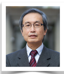
所 正文 教授 産業組織心理学