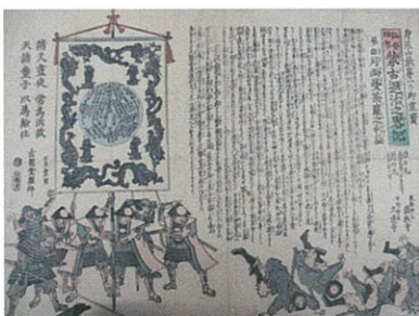
十、 蒙古退治之略記