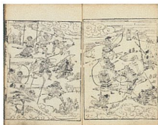
一一、 日蓮大聖人註画讃