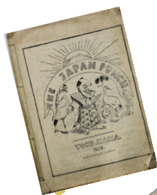
17. The Japan Punch