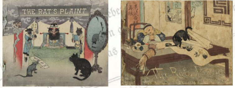
ちりめん本初版[1942] 1冊 ちりめん本第2版[1942] 1冊