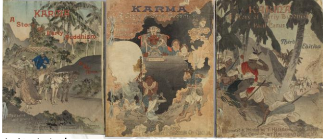
ちりめん本 初版 [1895] 1冊 第2版[1896] 1冊 第3版[1896] 1冊