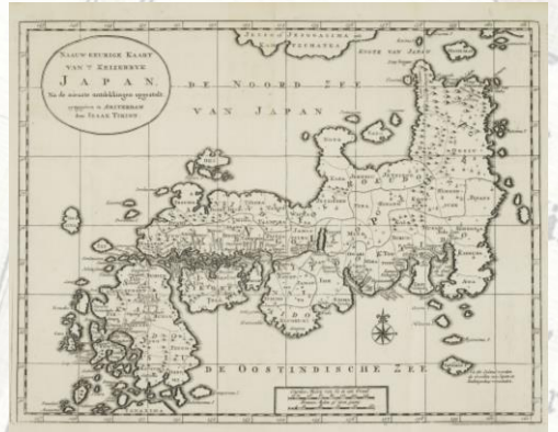
立正大学品川図書館