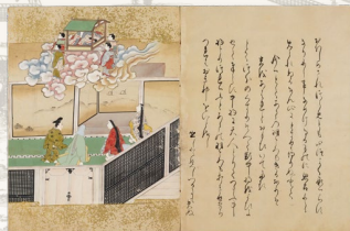
奈良絵本 竹取物語