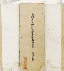
足利尊氏願經大般若経