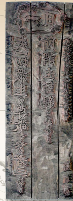
日蓮聖人聖語曆版本