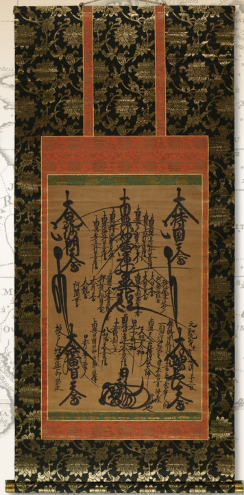
【日乾法華曼荼羅本尊】