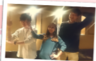
イラストと同じポーズで撮っていただきました!

とりあえず楽しい大学生活を送りたい。僕らの大学生活から皆さんに伝えられることはあまりありませんが、折角なのでぜひ。それは「人に優しくはしても、優しい人にはなりたい」ということです。あまりかたがたで抱えこんでしまったり、考えすぎてわからない問題、小細みの答えは、意外に道端に転がっているもので、ぜひ、その学生生活を、小本不評