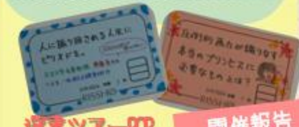
選書ツアーPOP 開催報告

図書館の使い方についてスタッフが分かりやすくお伝えする、「図書館ツアー」を行います。4月からグループでの申込受付を開始します。ご参加ください!