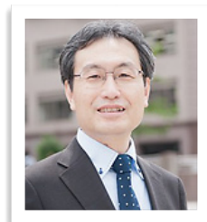
所 正文 教授 産業組織心理学