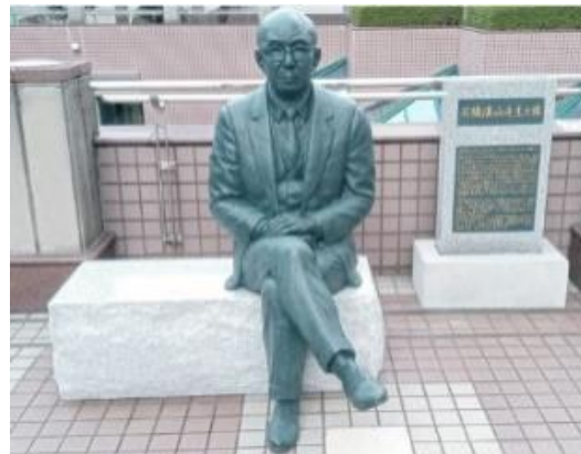
③ 石橋湛山先生之像