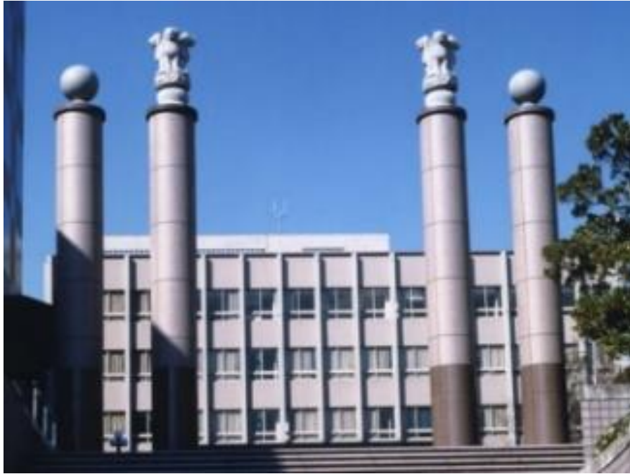
① アショカ・ピラー

建学の精神が刻まれた アショカ・ピラー 、修行僧姿の 日蓮聖人像 、中庭に鎮座する 石橋湛山先生之像 、ブロンズの巨大オブジェ プラブータ・ラトナ など、品川キャンパス内には数多くのモニュメントがあります。