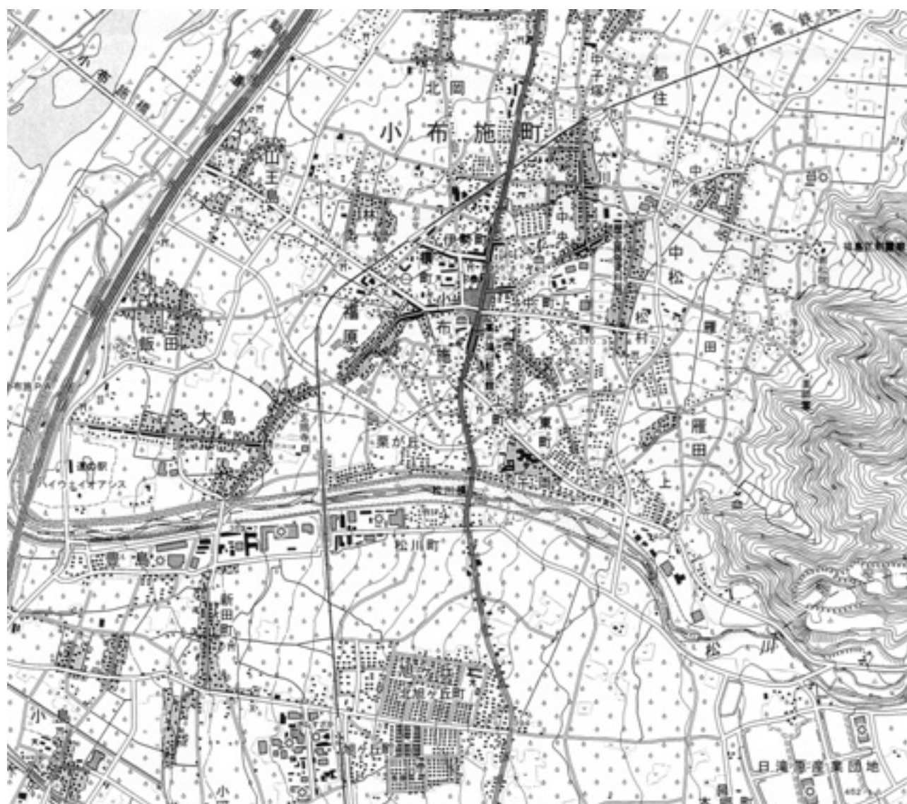
図2 2万5千分の1地形図「中野西部」(2006年発行、原寸)