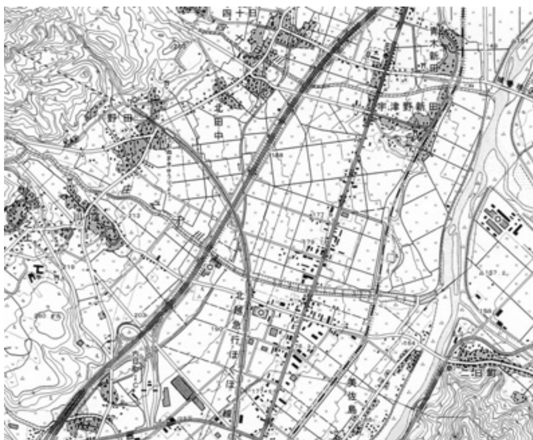
図1 2万5千分の1地形図「五日町」(2007年発行、原寸)